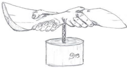
L'un pour l'autre d'Hugo BEYTRISON (bois)

Les œuvres retenues pour Lamazière-Basse sont :