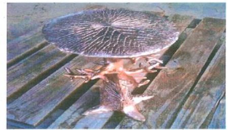
Force de vie de Karim OAK (métal)